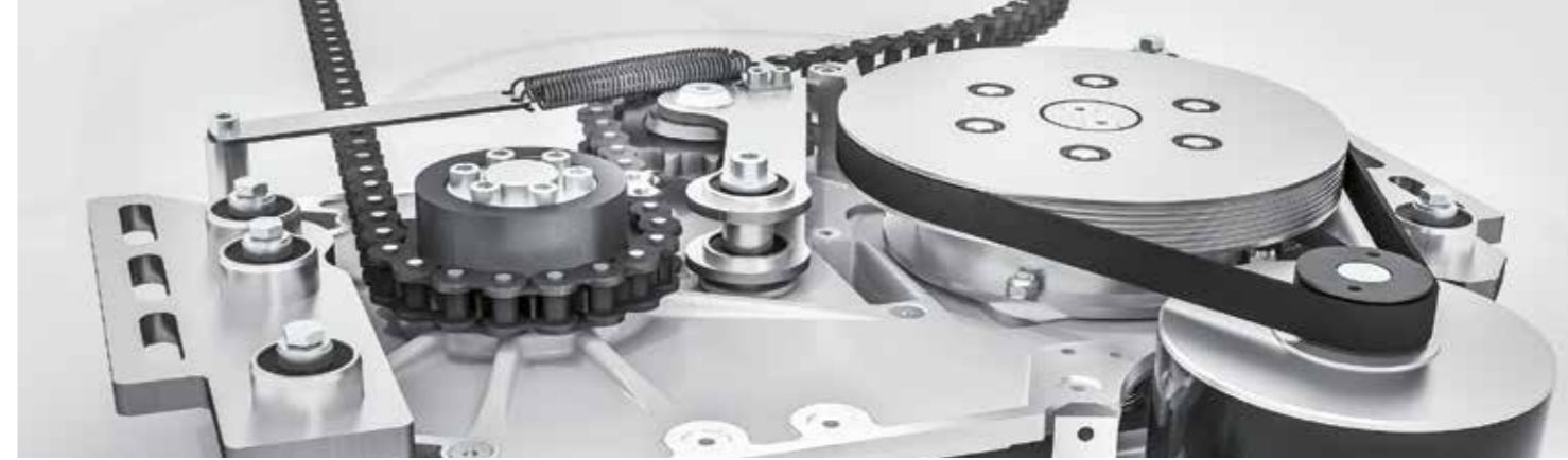
Ein leistungsstarker, verschleissfreier und hocheffizienter AC-Synchronmotor.

Die TORMAX T5 classic 3-wing / 4-wing Karusselltürsysteme stehen für modernste Technik und vielseitige Funktionalität. Sie lassen sich vollständig an Ihre Anforderungen anpassen und zeichnen sich durch zahlreiche herausragende Eigenschaften aus.