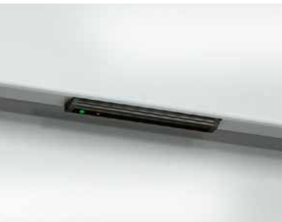
Diseño elegante concebido para cumplir los requisitos higiénicos más estrictos