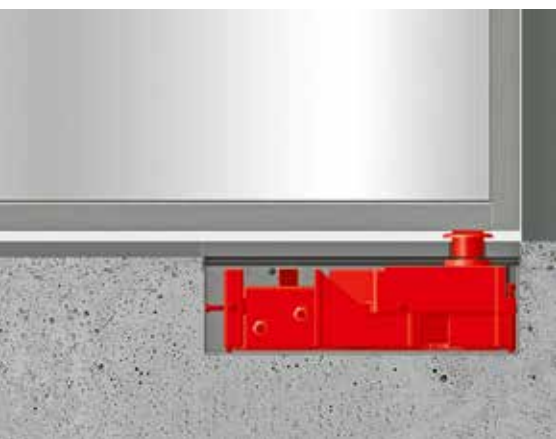
Accionamiento de puerta con montaje oculto bajo el suelo