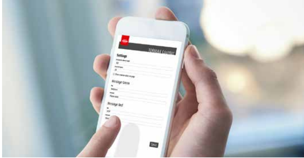
Einfache Bedienung über das Smartphone