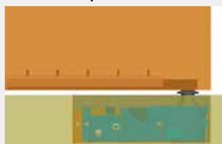
Con brazo de puerta integrado