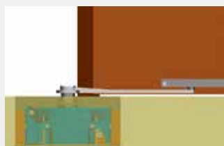
Varillaje de tirar