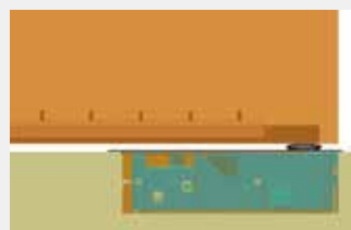
Con brazo de puerta integrado