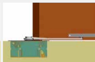
Varillaje de tirar