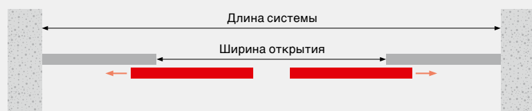
Двустворчатая дверь с неподвижными створками

2) для створки, в зависимости от веса створки и ширины открытия и преобладающих настроек